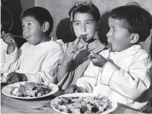
Tre af de grønlandske børn spiser. Billedet er taget på feriekolonien Fedgården tæt ved Faxe hvor børnene boede i starten af deres ophold i Danmark.

I 1951 blev 22 grønlandske børn sendt til Danmark som et eksperiment. Man håbede at børnene ville blive rigtig gode til at tale dansk og at de ville lære den danske kultur at kende. Så kunne de som voksne få de vigtigste stillinger i det grønlandske samfund og hjælpe Grønland med at udvikle sig.