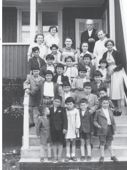
Eksperimentets 22 børn på trappen foran børnehjemmet i Nuuk. Foto fra bogen "For Flid og god opførsel" af Helene Thiessen, Milik Publishing

I Danmark boede børnene hos plejefamilier. Efter halvandet år i Danmark vendte 16 af børnene hjem til Grønland. De sidste 6 blev adopteret af deres danske plejefamilier.