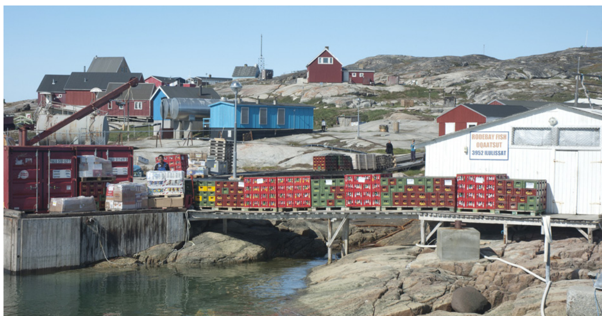
Bygden Rodebay nord for Ilulissat.

For langt størstedelen af bygderne er eksistensgrundlaget fiskeri kombineret med fangst. Ofte indgår fangsten ikke, eller kun i begrænset omfang, i bygdens registrerbare økonomi. Men fangsten bidrager i væsentlig grad til det lokale fødegrundlag, og specielt i de mindre bygder opretholdes de gamle traditioner med kødgaver til alle der ikke selv har mulighed for at gå på fangst hvor fangst i de større bygder primært distribueres inden for familiestrukturerne. Samtidig bidrager fangsten til den enkelte fangerfamilie samlede indkomst enten gennem bytte med anden fangst, bær eller tilsvarende fra andre distrikter, eller den sælges af uformelle kanaler over det meste af landet. Dermed udgør en stor del af fangsten og en del af fiskeriet den ikke registreret subsistensøkonomi.