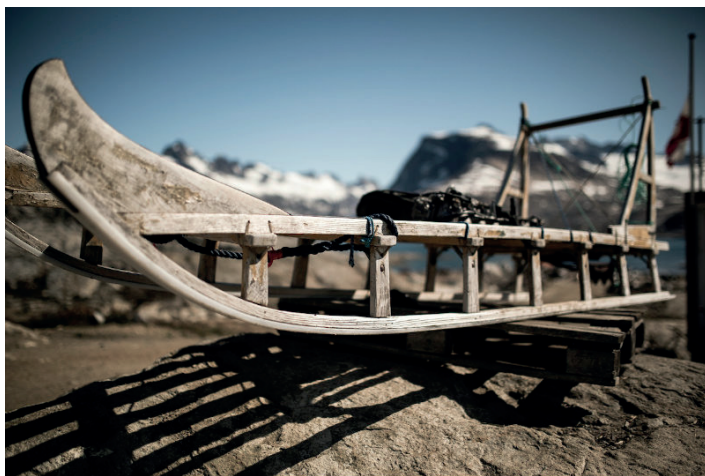
Slæde fra Østgrønland.