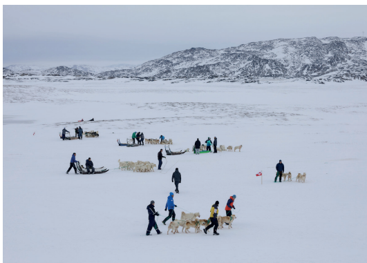
Hundeslædeløb i Uummanaaq

Byerne i hundslædedistriktet i Vestgrønland skiftes til at være værter for løbet. Hvert tredje år er løbet udvidet til også at omfatte kuske fra Qaanaaq (helt i nord) og Østgrønland.