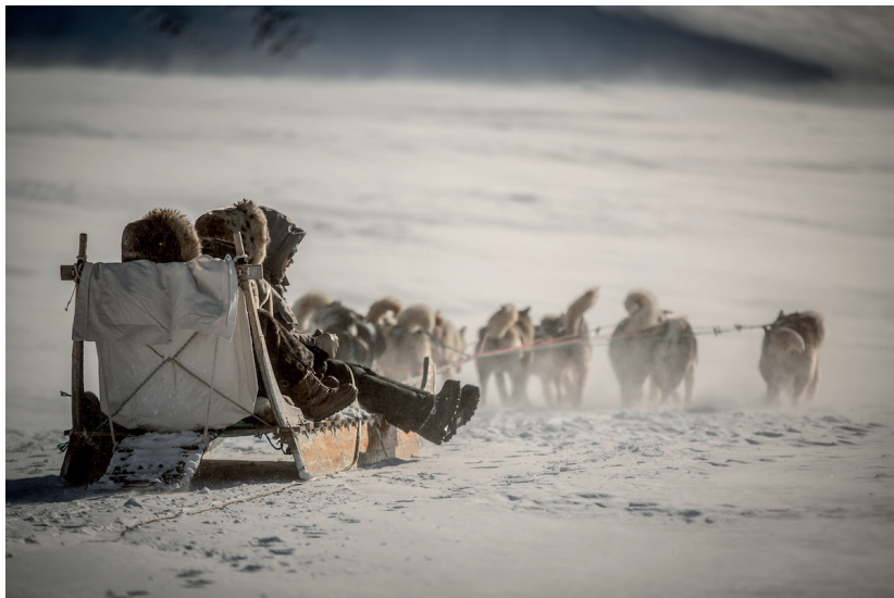
Hundeslædeløb i Uummannaq.

Hvert år afholdes der Grønlandsmesterskaber i hundslædekørsel. Det kaldes også Avannaata Qimusersua .