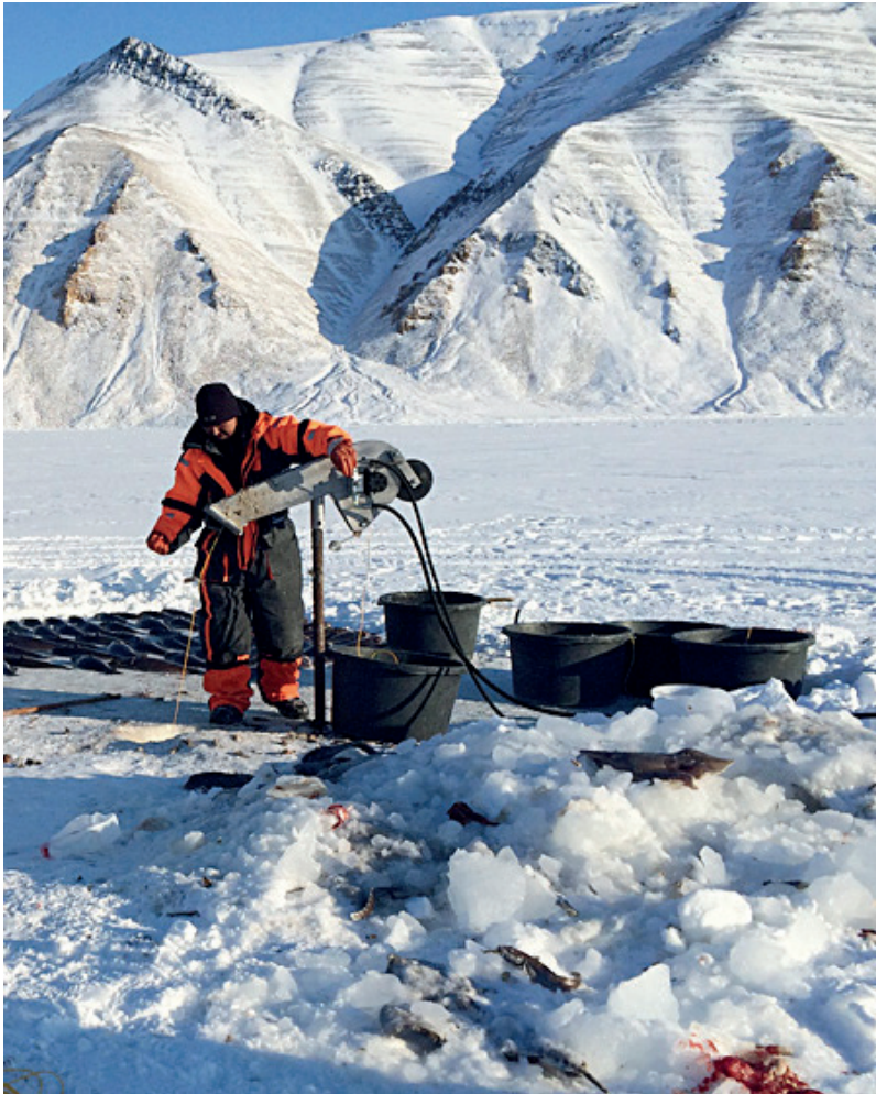
Fiskeri efter hellefisk med langline under isen.