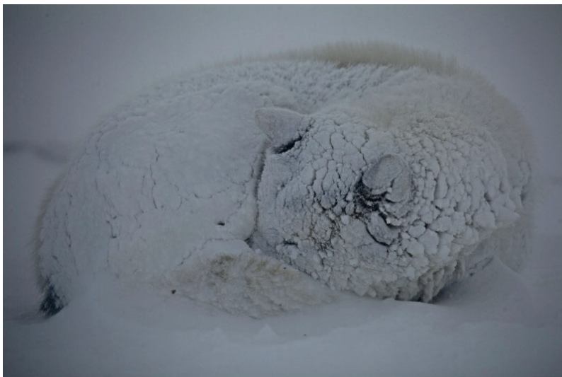
Slædehunden kan holde varmen i ned til minus 50 grader. Sneen hjælper med at holde på varmen.

En slædehund spiser mindst et kilo fisk eller sælkød om dagen, mere hvis det er koldt, eller hunden skal trække slæden. Foderet kan bestå af mange ting: fisk, sælkød, hvalroskød eller tørfoder.