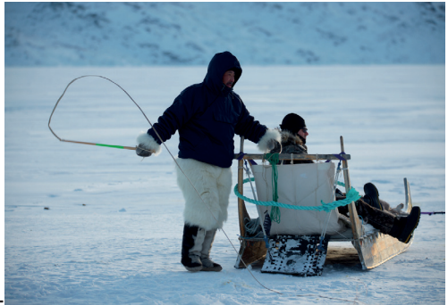
Hundepisken består af et skaft i træ og en lang snært af skind.

Slædekusken styrer sin hunde ved at slå smæld med en hundepisk og ved at råbe signaler til dem. Signalaråbene er forskellige fra sted til sted, men for eksempel råber vestgrønlænderne 'iju' for at svinge til højre og 'ili' for at svinge til venstre og 'ai' for at stoppe. Der er andre råb for 'langsomt' og 'hurtigt'.