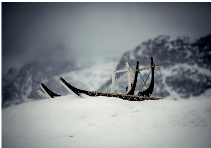
Slæder fra Vestgrønland.

Husk at indberette materiale som printes ud, til Copydan hvis din skole er indberetningspligtig.