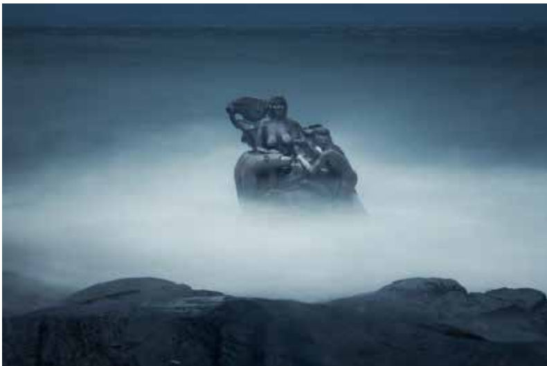
I Nuuk står en status af Havets Mor i vandkanten. Den er lavet af Christian Rosing.

Nivigká var en forældreløs pige, der boede på en boplads i Grønland. Hun havde en lampe og en hund, som var hendes kæreste øje.