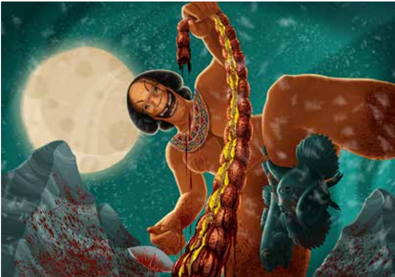
Indvoldsædersken. Illustration af Camilla Lillegaard Løvgreen fra bogen Bestarium Groenlandica af Maria Bach Kreutzmann

Hun har et mærkeligt aflangt ansigt og er helt nøgen – bortset fra to fisk der hænger fast i hendes skridt.