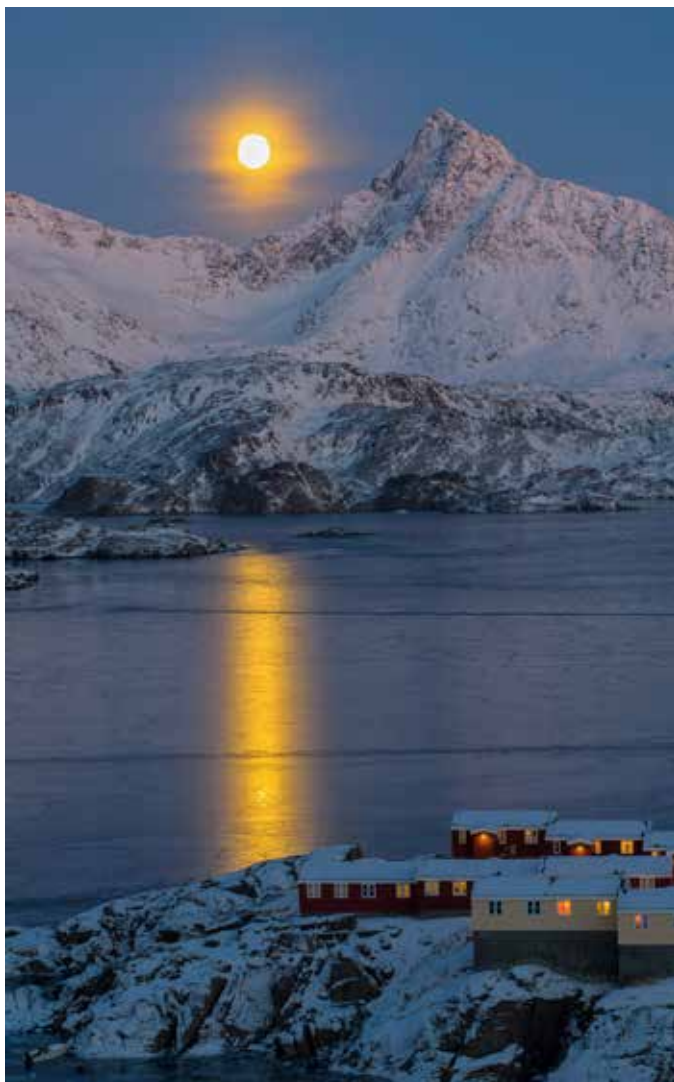
Måneskin i Grønland.