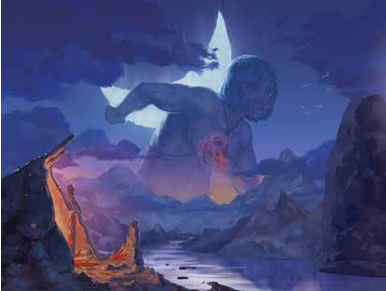
Månemanden. Illustration af Jonathan Brusch fra bogen Bestarium Groenlandica af Maria Bach Kreutzmann.