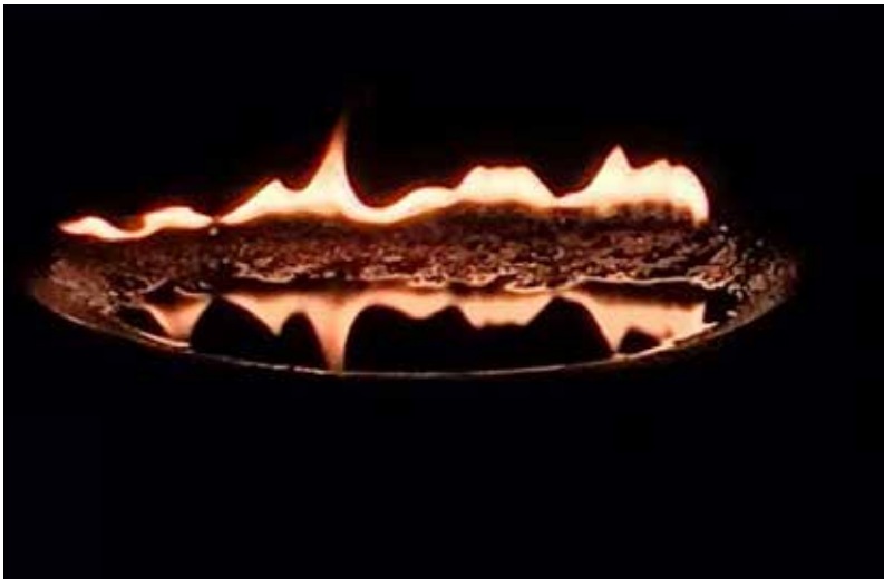
Nivigkás lampe i myten er en spæklampe som denne. Det er en skållformet lampe lavet i sten som man tændte med smeltet spæk og en væge af mos. Inuit brugte lampen til at give varme og lys i vinterboligerne.

Hun prøvede at redde sig op i båden ved at klamre sig til rælingen, men manden huggede hendes fingre af – de tre midterste – så hun måtte give slip.