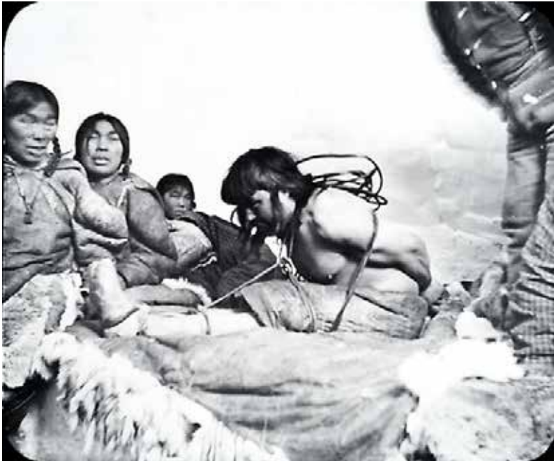
En åndemaner i trance i 1906. Åndemaneren sidder foran indgangen til huset, nøgen og med hænderne og kroppen bundet. Trommens stærke lyd og skindenes raslen påkalder ånderne.

Derfor var åndemaneren nødt til at tage på ånderejse for at besøge hende. Han påkaldte sin hjælpeånd til at hjælpe ham undervejs på den farefulde rejse.