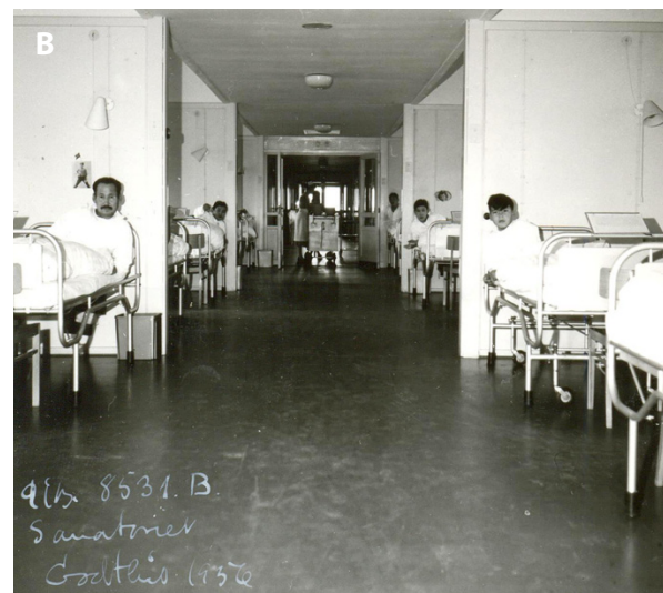
Dronning Ingrid's Sanatorium 1956 (A). Indlagte (B).