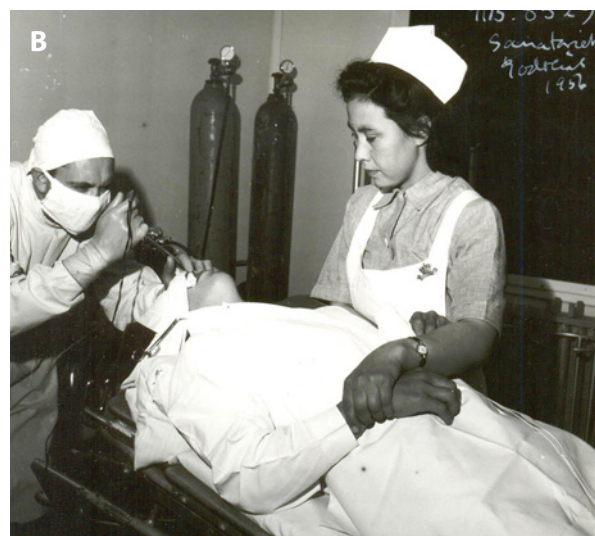
Røntgenundersøgelse (A) og bronkoskopi (B). (Foto: Grønlands Nationalmuseum og Arkiv).