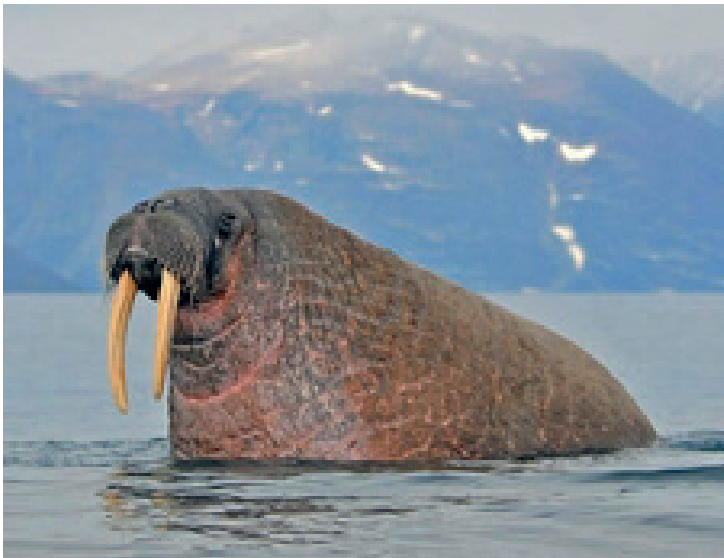
Hvalros.

Den får kun en unge hvert andet år, i maj-juni. Der lever omkring 4.500 hvalrosser i Grønland fordelt på tre bestande.