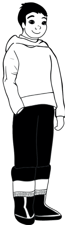
Tegninger: Laila Vetterlain