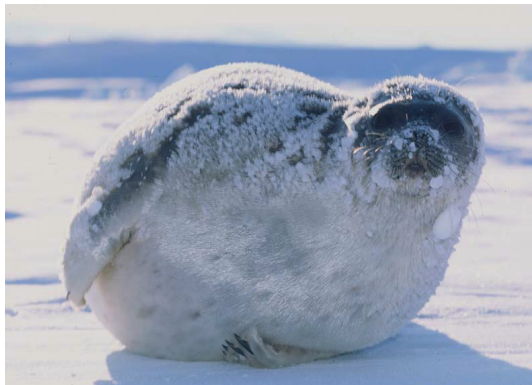
Ringsæl. Foto: Aqqalu Rosing-Asvid/ Grønlands Naturinstitut

Man regner med at der er omkring fem millioner ringsæler i Arktis.