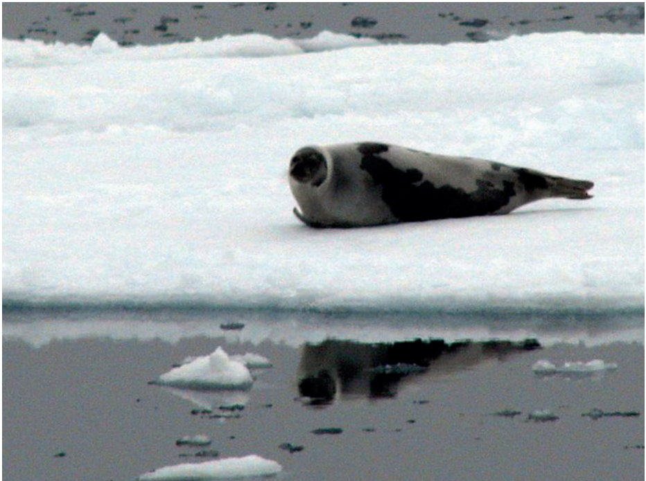
Ældre grønlandssæl med tydelige aftegninger på ryggen.

I Grønland lever der seks forskellige sælarter. På de næste sider kan du læse om de seks forskellige slags sæler i Grønland.