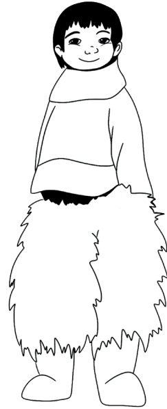
Tegninger: Laila Vetterlain

I Østgrønland bærer kvinderne en hvid anorak med blå, røde og hvide perler.