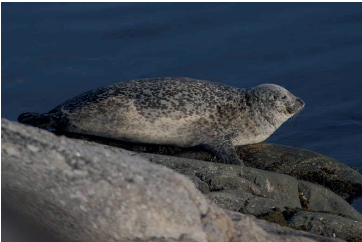
Spættet sæl.

Den spættede sæl lever inde i fjordene, og om sommeren kan de finde på at svømme op i elvene for at fange ørreder.