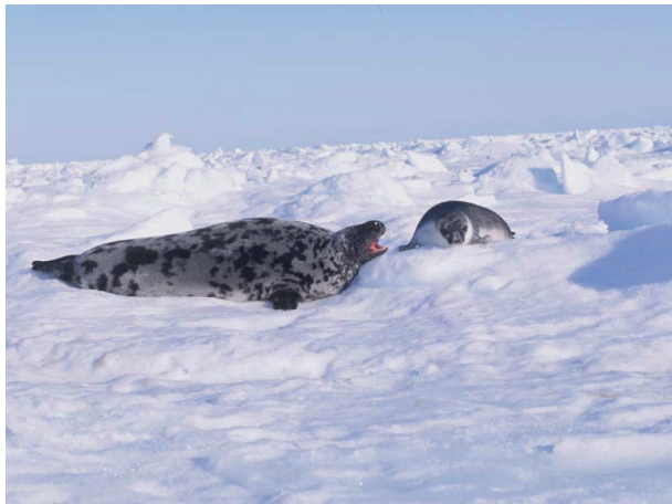
Klapmyds med unge.

Der lever omkring 80.000 klapmydser ved Grønland.