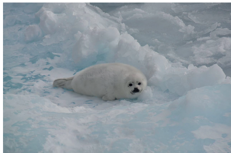
En grønlandssælunge på isen i Canada.

Der er ca. 7,4 mio. grønlandssæler i det vestatlantiske område som grønlandssælerne i Grønland er en del af.