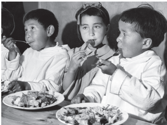
Tre af de grønlandske børn spiser. Billedet er taget på feriekolonien Fedgården tæt ved Faxe hvor børnene boede i starten af deres ophold i Danmark.

I 1951 blev 22 grønlandske børn sendt til Danmark som et eksperiment. Man håbede at børnene ville blive rigtig gode til at tale dansk og at de ville lære den danske kultur at kende. Så kunne de som voksne få de vigtigste stillinger i det grønlandske samfund og hjælpe Grønland med at udvikle sig.